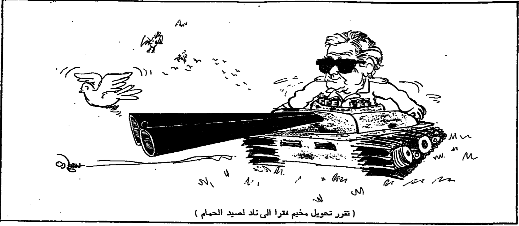
(تقرر تحويل مخيم فقرا الى ناد لصيد الحمام)